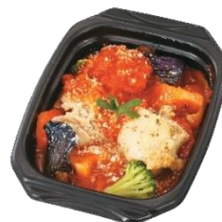
グリルチキンと5種野菜のトマト煮